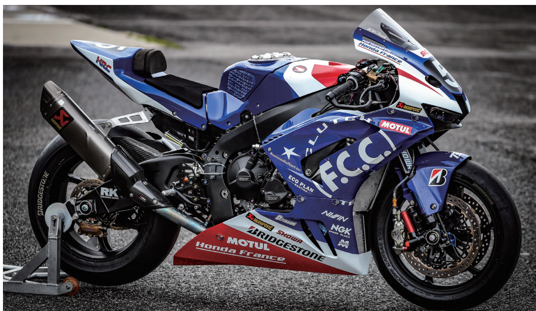
F.C.C. TSR Honda France 2020 CBR1000RR-R TSR-EWC Specifications

レーススケジュールについては、まだEWCからの正式な発表はありませんが、今のところ、4月のル・マン24時間、5月オッシャースレーベン、7月の鈴鹿8耐、9月ボルドール、そして12月のセパンと全5戦開催を見込み、年度を繰り越さずに2021シーズンとして開催するという情報を聞いています。