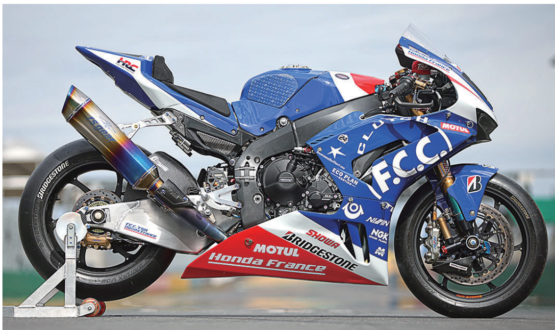
*2023CBR1000RR-R Fireblade SP IN OFFICIAL PRETESTING @ LM 装着モデルはテスト用のプロトタイプ

チタンを素材にした芸術品のようなエキゾーストシステムも是非楽しみにお待ち下さい。