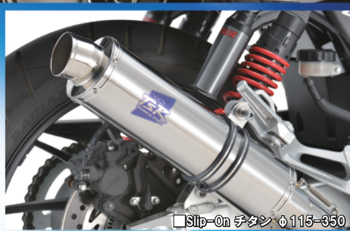
Slip-On チタン φ115-350